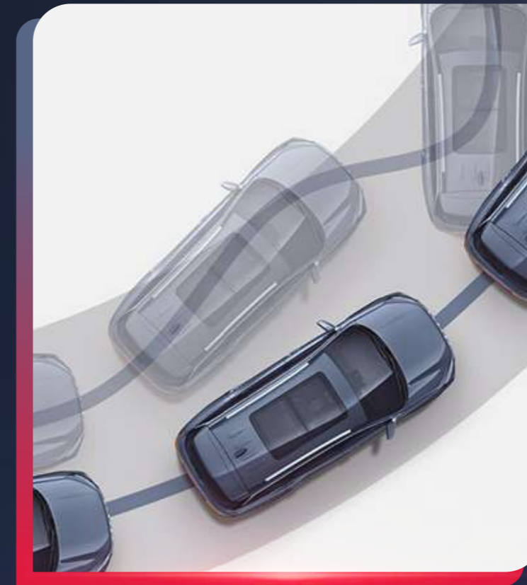
SISTEMA DE CONTROL DE ESTABILIDAD (ESP)