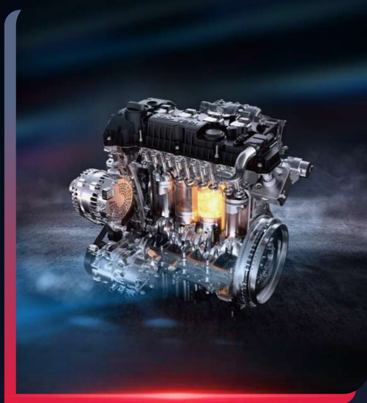
MOTOR 2.0 TURBO

La Jetour X90 PLUS es una SUV completa, gracias a su equipamiento de vanguardia que incluye un motor 2.0 turbo, proporcionando un rendimiento excepcional en todo tipo de rutas.