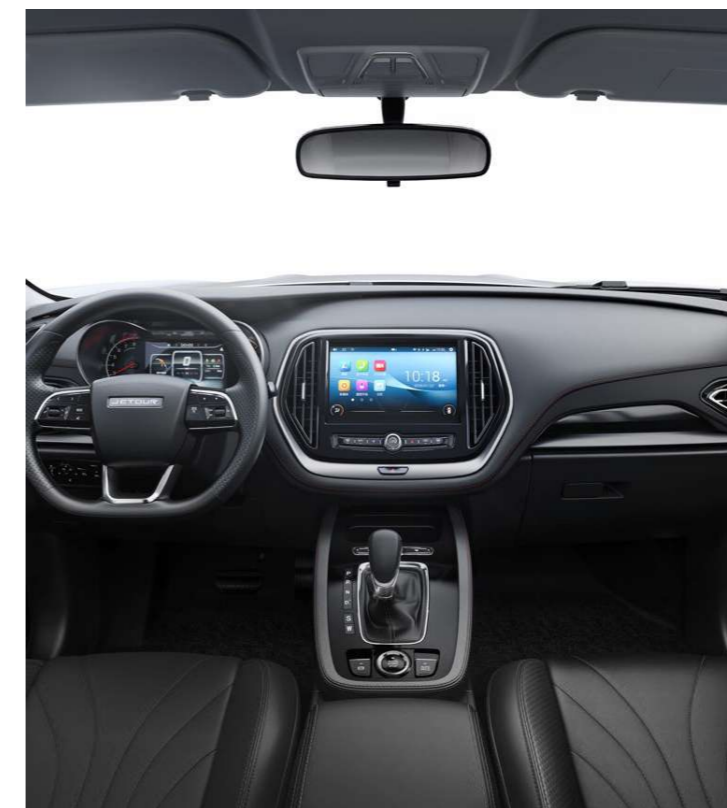
PANTALLA DE INFOENTRETENIMIENTO DE 10"