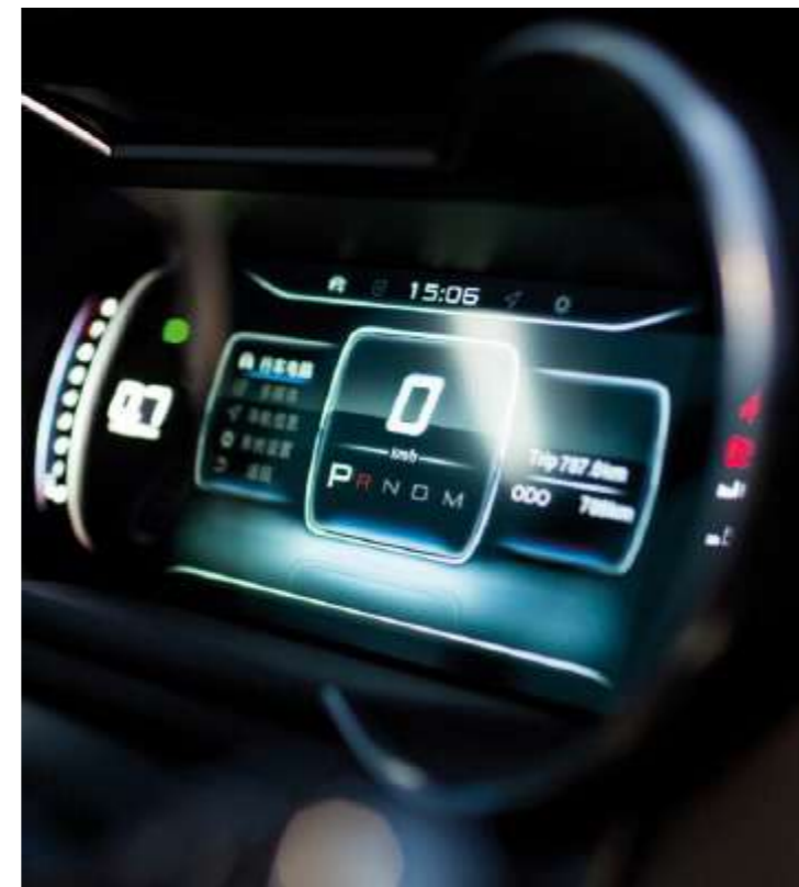
DIGITAL COCKPIT DE 12.3"