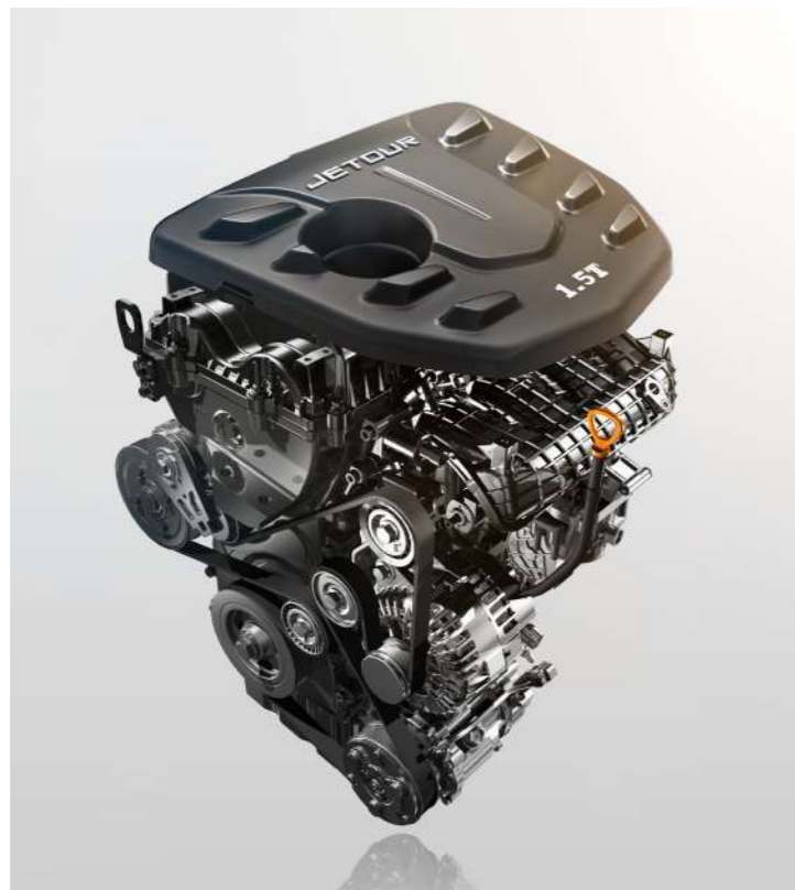
MOTOR 1.5 TURBO

Pon a prueba la resistencia de esta gran SUV