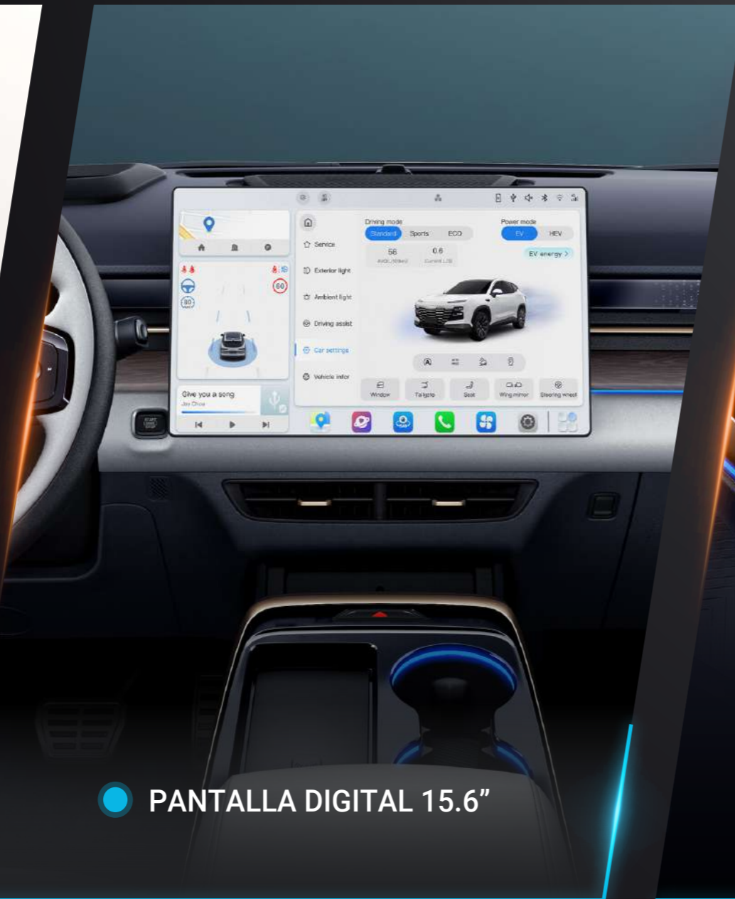
● PANTALLA DIGITAL 15.6"