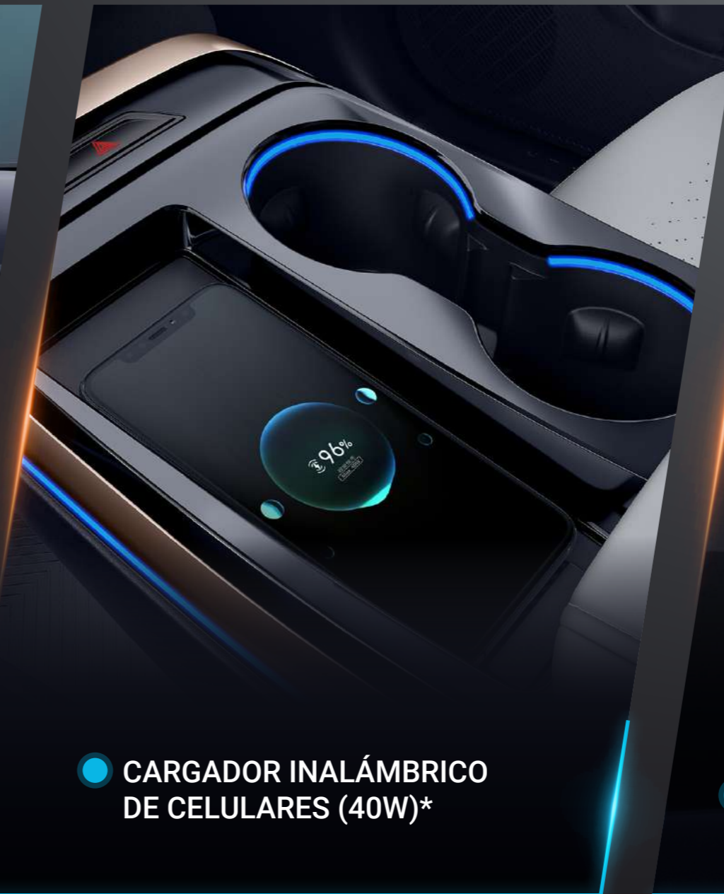
● CARGADOR INALÁMBRICO DE CELULARES (40W)*