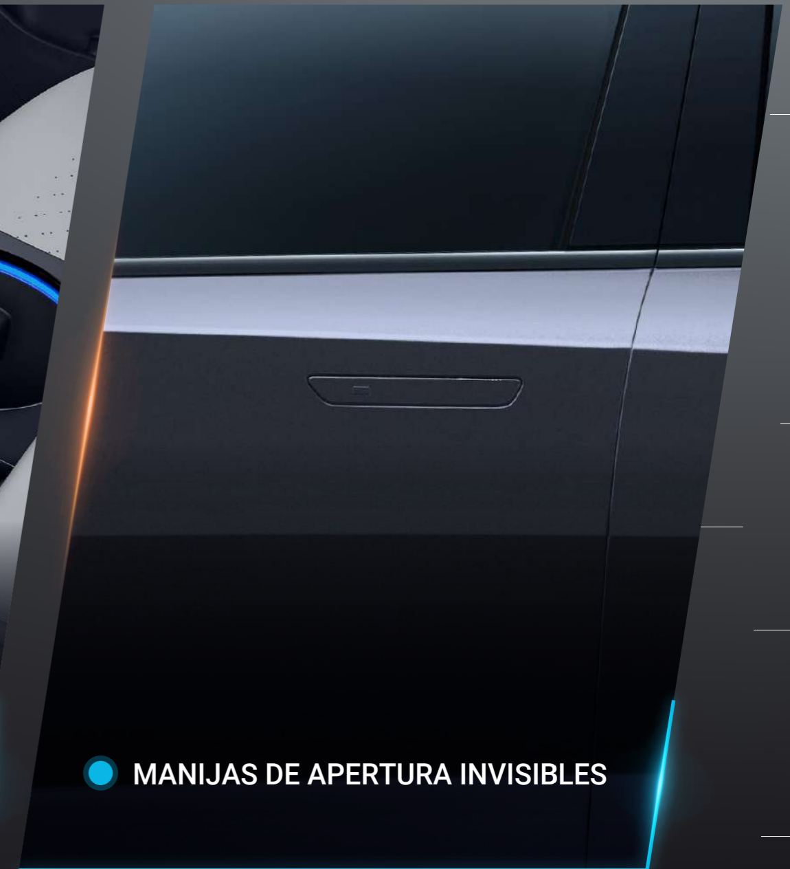
● MANIJAS DE APERTURA INVISIBLES

>>> Pon a prueba la resistencia de esta gran SUV