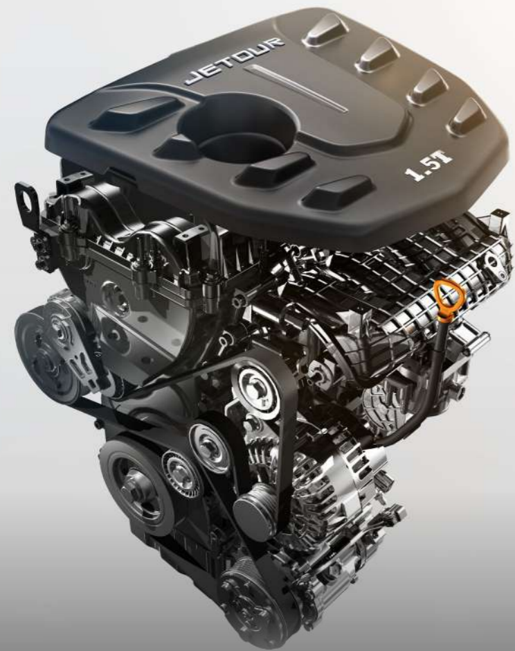
● MOTOR 1.5T Y 1.6T GDI

La tecnología de Jetour Dashing va más allá gracias al sistema de cierre y apertura automático "KEYLESS". Con 2 opciones de motorización , 1.5T y 1.6T GDI, no habrá ruta sin recorrer.