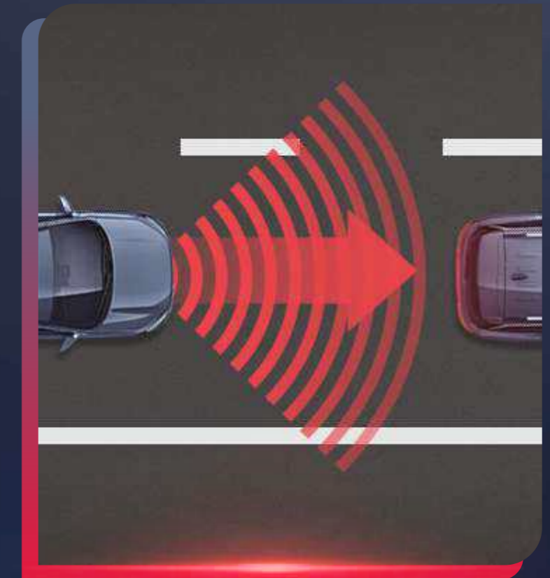
SISTEMA DE FRENADO AUTÓNOMO CON CRUCERO ADAPTATIVO

Pon a prueba la resistencia de esta gran SUV