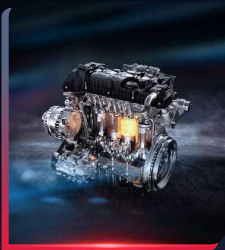
MOTOR 2.0 TURBO

La Jetour X90 PLUS es una SUV completa, gracias a su equipamiento de vanguardia que incluye un motor 2.0 turbo, proporcionando un rendimiento excepcional en todo tipo de rutas.