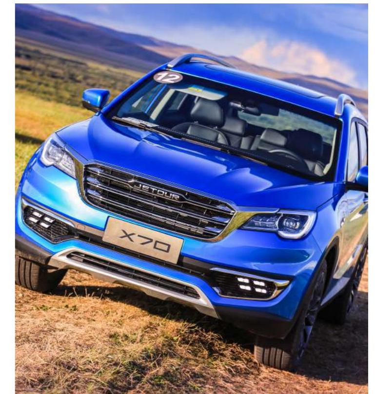
ABS + BAS + EBD + TCS + HSA + Autohold