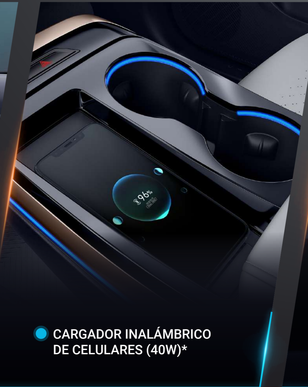
● CARGADOR INALÁMBRICO DE CELULARES (40W)*