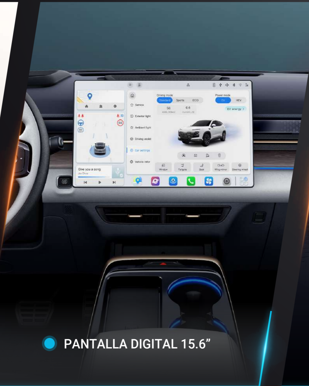
● PANTALLA DIGITAL 15.6"